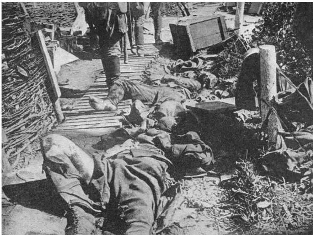
Dokument 7B: Na ruském obvažišti